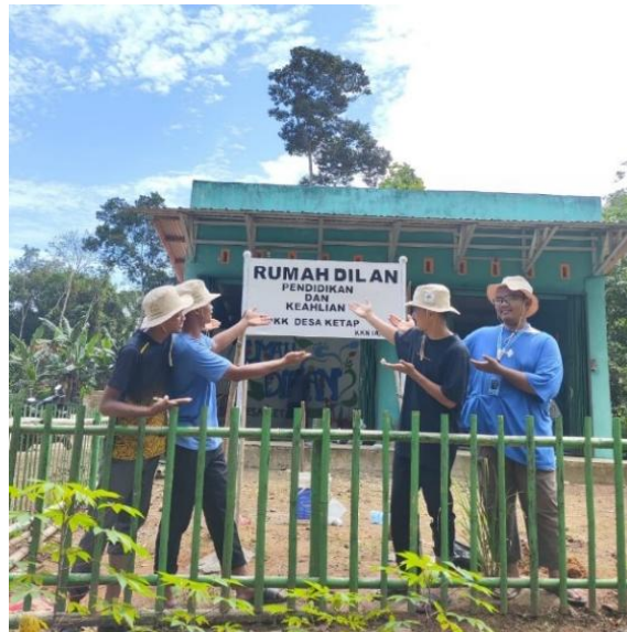
Gambar 2. Pembuatan papan nama Rumah Dilan

Pembuatan papan nama untuk Rumah Dilan dimulai dengan tahap perencanaan dan desain yang dipimpin oleh divisi lingkungan. Pertama-tama, tim melakukan penulisan tulisan rumah dilan untuk mempermudah penyemprotan pilok. Tujuannya adalah untuk menciptakan papan nama yang berfungsi untuk memberi tahu bahwa Rumah Dilan ini.