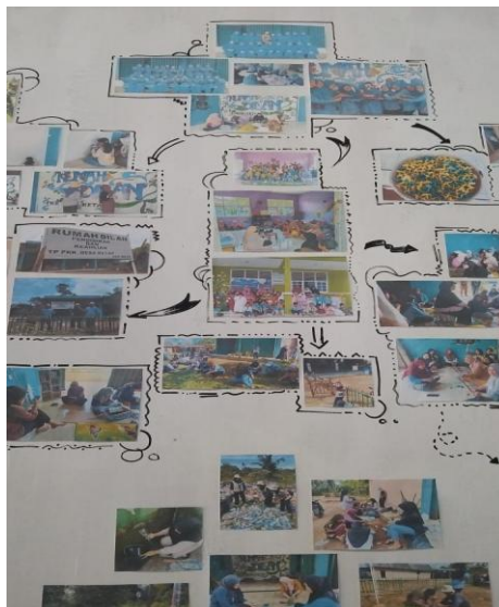
Gambar 5. Bagan foto kegiatan

Proses pembuatan Bagan Foto Kegiatan dimulai dengan mengumpulkan dokumentasi foto dari setiap kegiatan yang telah dilakukan. Foto-foto ini harus mencakup berbagai aspek kegiatan, mulai dari perencanaan, pelaksanaan, hingga hasil akhir. Selain itu, pilih foto-foto yang berkualitas baik dan mampu mewakili momen-momen penting dari setiap aktivitas. Setelah foto-foto terkumpul, cetaklah foto-foto tersebut dalam ukuran yang acak sesuai kebutuhan, agar mudah diatur dan dilihat dengan jelas ketika ditempel di dinding. 5