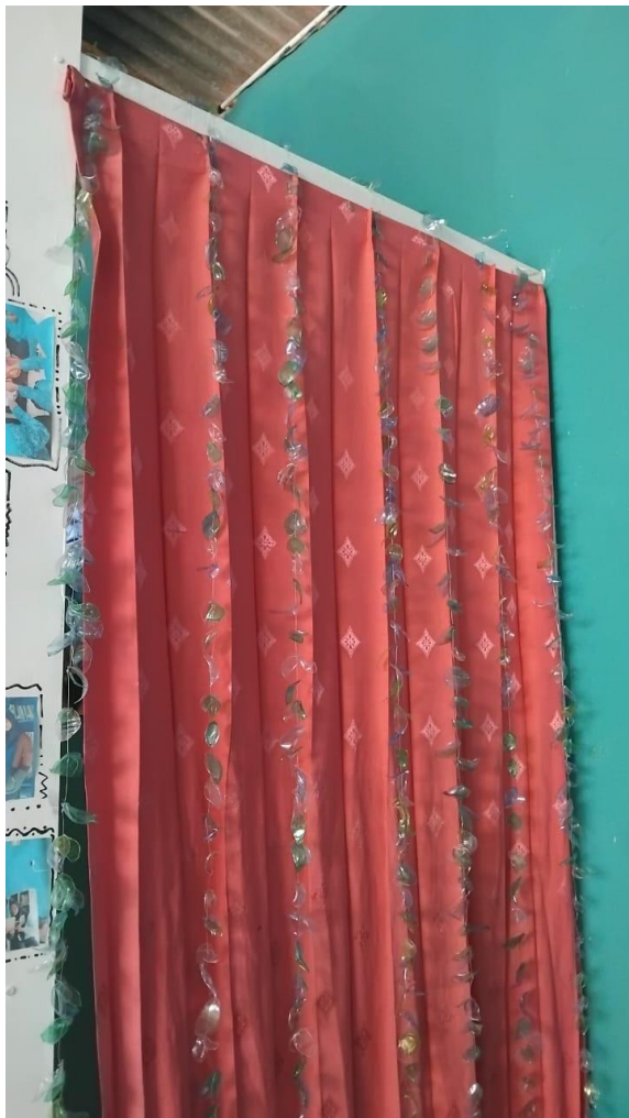
Gambar 8. Tirai dari botol plastik

Langkah pertama dalam pembuatan tirai ini adalah menyiapkan botol bekas yang akan digunakan. Botol-botol tersebut perlu dibersihkan dengan baik dan dikeringkan sebelum dipotong. Pilih botol dengan warna dan bentuk yang sesuai dengan desain tirai yang diinginkan. Setelah itu, botol-botol tersebut dipotong menjadi bagian-bagian kecil. Gunting botol dengan hati-hati untuk menghasilkan potongan yang seragam. Pastikan ukuran potongan kecil, sedang, dan besar sesuai dengan pola