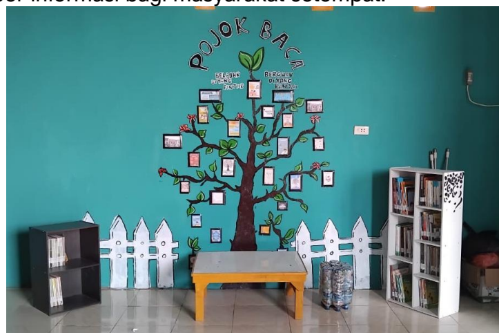
Gambar 7. Pojok baca

Pojok Baca adalah sebuah inisiatif yang bertujuan untuk meningkatkan minat baca masyarakat, terutama di kalangan anak-anak dan remaja. Tempat ini biasanya didesain dengan suasana yang nyaman dan menarik untuk mendorong pengunjung menghabiskan waktu lebih banyak dengan buku. Pojok Baca bisa ditempatkan di berbagai lokasi, seperti sekolah, balai desa, atau taman umum. Dengan menyediakan berbagai jenis buku dan materi bacaan, Pojok Baca diharapkan dapat menjadi pusat belajar dan sumber informasi bagi masyarakat setempat.