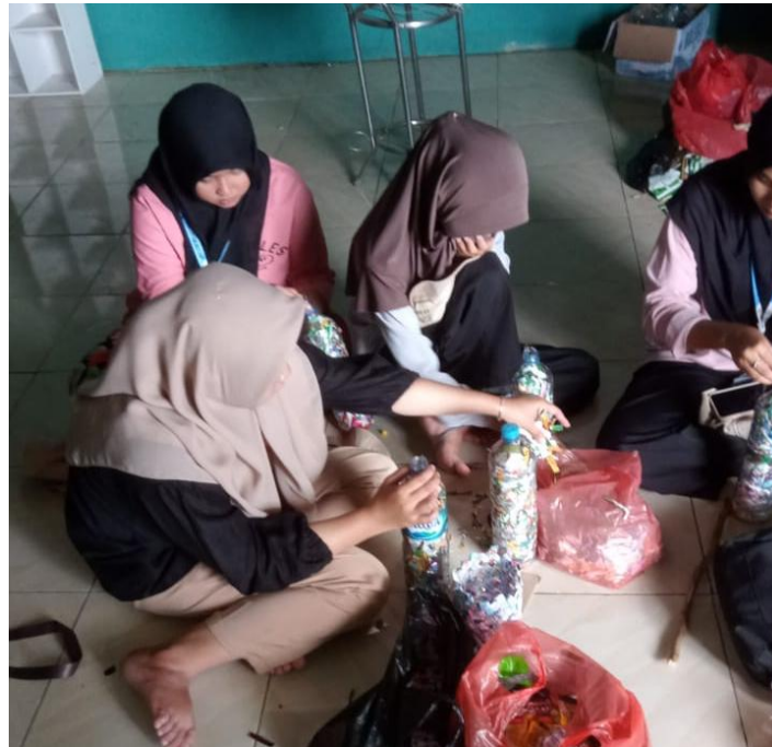
Gambar 4. Proses pembuatan kursi dari sampah plastik

Langkah pertama dalam pembuatan kursi ini adalah mengumpulkan botol plastik bekas dan sampah plastik lainnya. Botol-botol ini dapat berasal dari rumah tangga, sekolah, atau tempat umum lainnya. Mahasiswa KKN biasanya membantu dalam mengkoordinasikan pengumpulan sampah plastik ini, bekerja sama dengan masyarakat setempat untuk memastikan ketersediaan bahan yang cukup. Setelah bahan terkumpul, langkah berikutnya adalah membersihkan botol-botol plastik untuk memastikan tidak ada kotoran yang dapat merusak kursi nantinya.