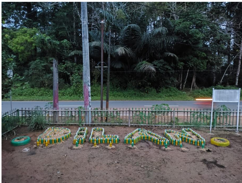
Gambar 9. Pembuatan karibokas

Langkah pertama dalam pembuatan Karibokas adalah menyiapkan botol bekas. Botol-botol ini harus dicuci bersih dan dikeringkan sebelum digunakan. Pastikan tidak ada label atau residu yang tersisa di botol. Setelah botol-botol bersih, langkah berikutnya adalah memotong botol sesuai dengan bentuk dan ukuran yang diinginkan. Potongan botol ini akan menjadi bagian dasar dari kerajinan yang akan dibuat. Dalam hal ini, botol-botol tersebut sering kali dipotong menjadi bagian-bagian kecil untuk membentuk pola atau struktur tertentu. Langkah berikutnya adalah mengisi botol dengan pasir. Pasir digunakan untuk memberikan stabilitas dan berat pada kerajinan yang akan dihasilkan. Untuk melakukannya, isi botol dengan pasir secukupnya, lalu rapatkan tutup botol. Pasir tidak hanya memberikan keseimbangan pada kerajinan tetapi juga dapat memberikan efek visual yang menarik saat botol ditampilkan.