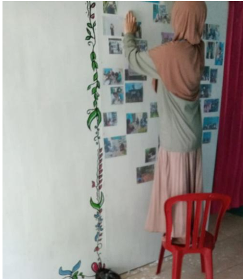
Gambar 3. Lukisan Bingkai Tanda Tangan

Lukisan Bingkai Tanda Tangan adalah karya seni yang menggabungkan keindahan visual dengan personalisasi melalui tanda tangan. Dalam desain ini, Sundari menggunakan elemen alam sebagai inspirasi utama, menciptakan harmoni antara alam dan individualitas. Lukisan ini biasanya menampilkan tanda tangan yang dikelilingi oleh bingkai yang terinspirasi dari elemen-elemen alam seperti daun, bunga, ranting, atau air. Penggunaan elemen alam ini memberikan kesan organik dan natural pada karya seni, mencerminkan keindahan dan ketenangan alam yang abadi.