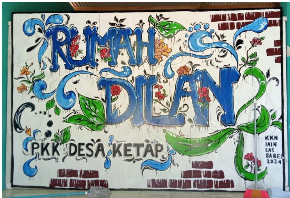
Gambar 1. Lukisan Rumah Dilan

Pembuatan lukisan tulisan "Rumah Dilan" yang didesain oleh Sundari adalah sebuah karya seni yang memadukan elemen tetesan dan garis-garis untuk menciptakan sebuah komposisi yang unik dan menarik menjadikannya misterius. Lukisan ini menggambarkan esensi dari "Rumah Dilan" dengan cara yang kreatif dan artistik, menggabungkan unsur-unsur visual yang mampu mengekspresikan keindahan serta pesan yang ingin disampaikan. Dalam karya ini, Sundari menggunakan teknik yang memperlihatkan keahliannya dalam memanipulasi garis dan tetesan cat untuk membentuk sebuah lukisan yang dinamis dan penuh makna.